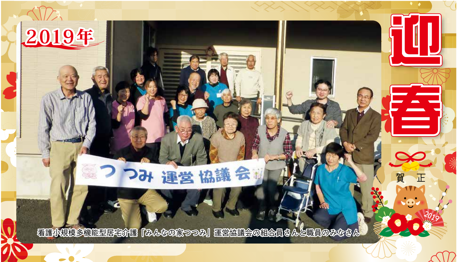
看護小規模多機能型居宅介護「みんなの家つつみ」運営協議会の組合員さんと職員のみなさん

群馬中央医療生活協同組合 発行 371-0811 前橋市朝倉町830-1 発行人 岡田桂一 TEL 027-265-3531 編集 ぐらしと健康編集委員会 FAX 027-265-3532 http://www.kyouritsu.org/ 定価 1部 30円(組合員の購読料は出資金に含まれています)