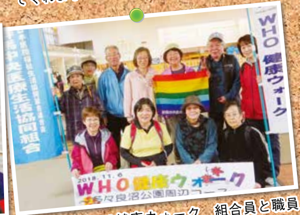
11月 WHO健康ウォーク 組合員と職員がウォーキングを楽しみながら交流