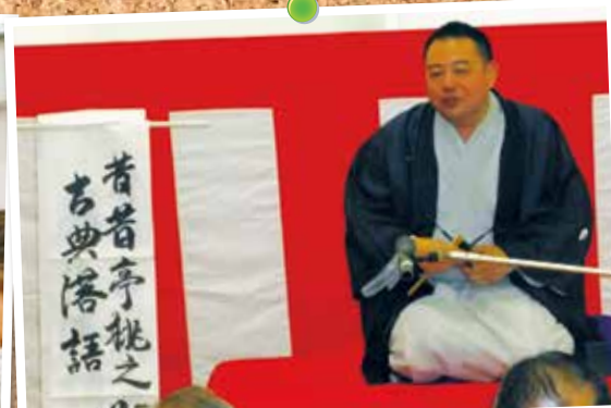
7月 原水禁世界大会派遣に向けて桐生地区平和コンサートを開催