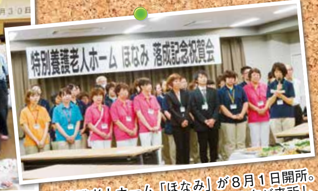
特別養護老人ホーム「ほなみ」が8月1日開所。内覧会や落成祝賀会にはたくさんの方が来所してくれました