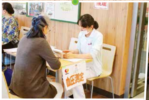
「4・7WHO世界保健デー 全国いっせいまちかど健康チェック」では、協同組合間連携として初めてJAの店舗(JAファーマーズ朝日店)にて実施