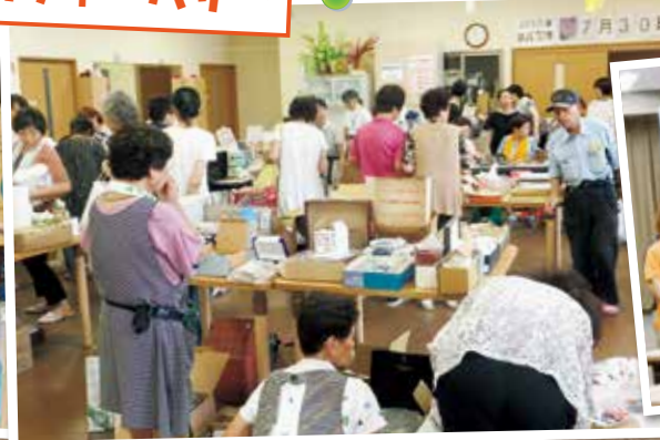
7月 太田協立診療所外来待合室にてバザー&ピースコンサートを開催