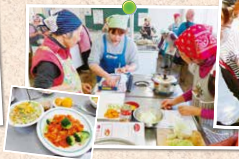
前橋東南部ブロック「くらしに役立つ教室」には、多くの職員が講師として参加しました