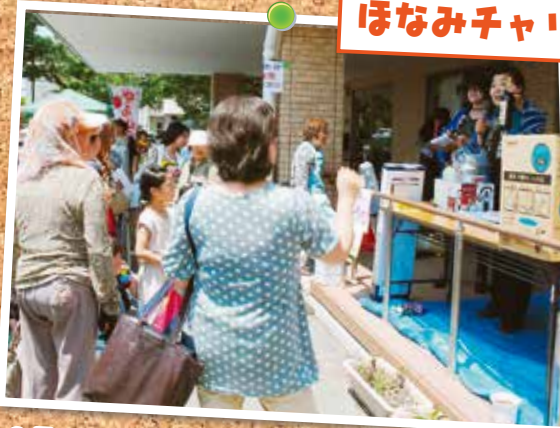
6月 前橋協立病院敷地内にてチャリティーバザー&オークションを開催