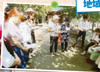
組合員と職員がペアで地域を訪問 多くの職員が参加しました