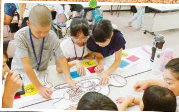
8月15日 前橋協立病院主催の「夏休み子ども保健教室」が開催され、クイズや医療体験など多彩な企画で健康について学びました