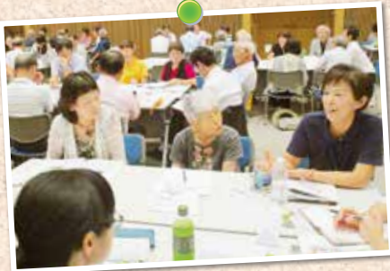
8月29日 組合員職員合同研修会では、各地区の豊かな実践報告を共有し生協強化月間への取り組みについて討議しました