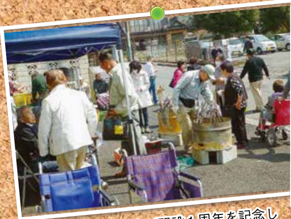
「みんなの家つつみ」が開設1周年を記念して4月に祝賀会を開催