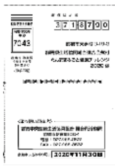
エントリーシートを提出