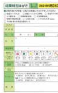
結果報告ハガキを提出