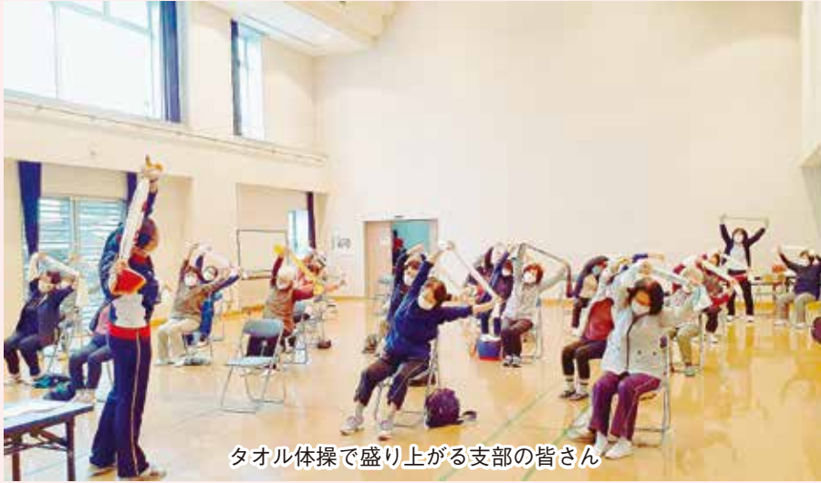
タオル体操で盛り上がる支部の皆さん