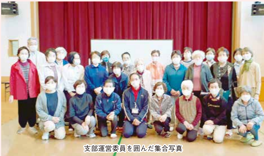
支部運営委員を囲んだ集合写真

2000年に発足し、一時休止していた前橋北支部の活動が、8月から再開し、10月9日に支部長と運営委員さんのお披露目会がおこなわれました。当日は、30人ほどの組合員さんが参加し、理事の方々のご挨拶やリハビリ職員による体操など、大盛況となりました。