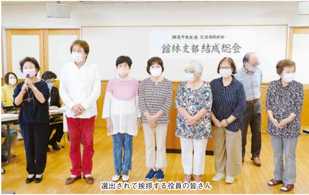
選出されて挨拶する役員の方皆さん

9月13日(日)の午後、館林市城沼公民館にて館林市、板倉町、明和町を活動地域とする館林支部結成総会が開