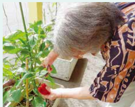
赤ピーマンを 収穫する利用者さん