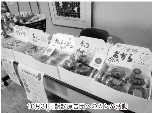
10月31日訴訟原告団へのカンパ活動