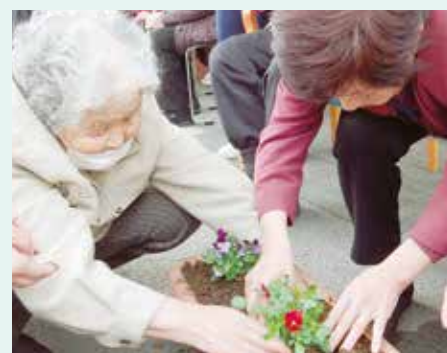
パンジーをプランター へ植える利用者さん