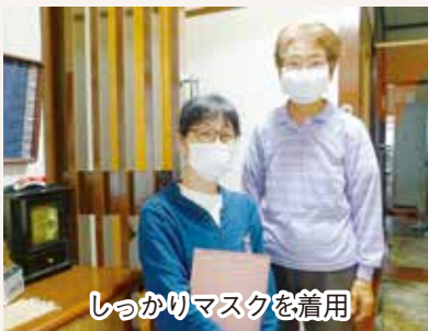
しっかりマスクを着用