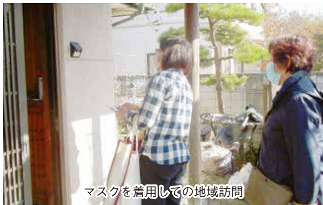
マスクを着用しての地域訪問

天川天川原支部では、「お困りごと相談シート」を機関誌に折り込み配布を行ったところ、