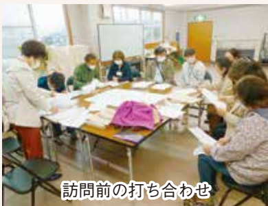
訪問前の打ち合わせ

宝泉支部は、診療所を利用していない方からも郵便振り込みで数件の増資がありました。後日、支部運営委員会の方々が、おれの手紙を持ってあいさつにうかがいました。