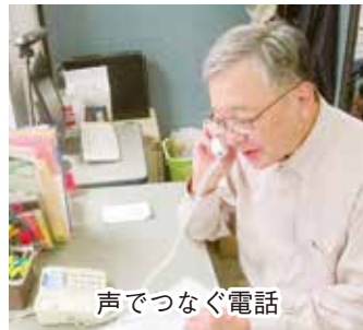
声でつながる電話