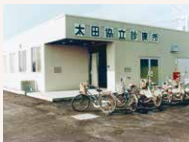
1977年 太田協立診療所開設 (太田市石原町)