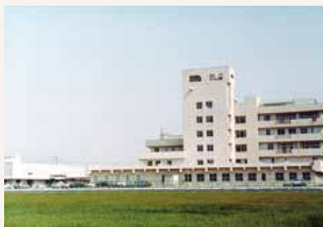
1980年 前橋市朝倉町に前橋協立病院として新築移転 197床