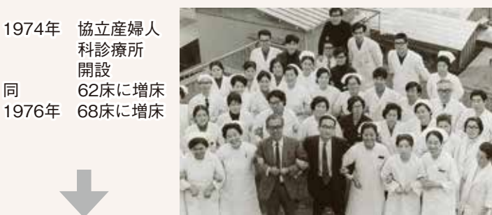
1974年 協立産婦人科診療所開設 同 62床に増床 1976年 68床に増床