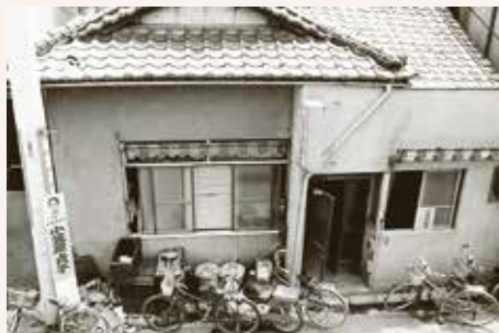
1952年 3つの診療部門を開設 写真は協立一毛町診療所(現在の前橋市城東町)