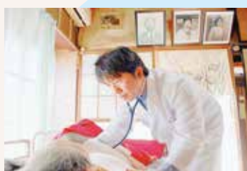
前橋協立診療所で在宅療養支援診療所開始