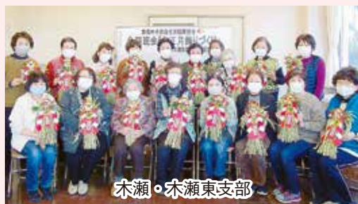
木瀬・木瀬東支部