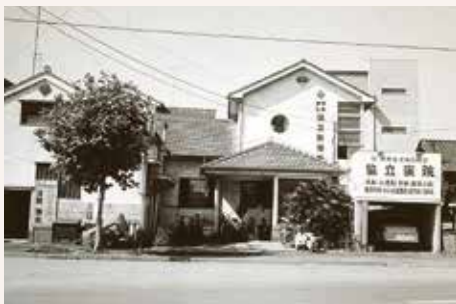
1961年 本町の協立診療所は38床の協立病院へ