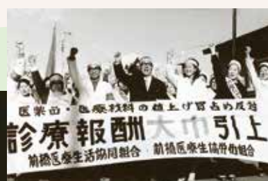
1997年 医療改悪反対・消費税増勢ストップのデモ行進