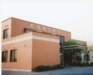
1987年 太田協立病院病床25床