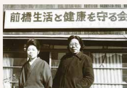
1957年 「生活相談部」設置 専任相談員が様々な生活相談を受けた