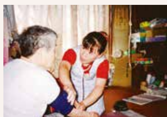
ヘルパー事業開始 1999年より太田市委託で ホームヘルプ委託事業開始