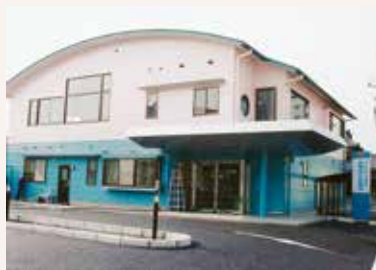
1999年 城東町診療所と本町診療所を統合し、協立診療所を開設