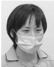
堀込ソーシャルワーカー