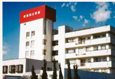
1994年 2期建設でリハビリ室などを増築 その話、3期・4期の工事を経て現在(189床)に至る