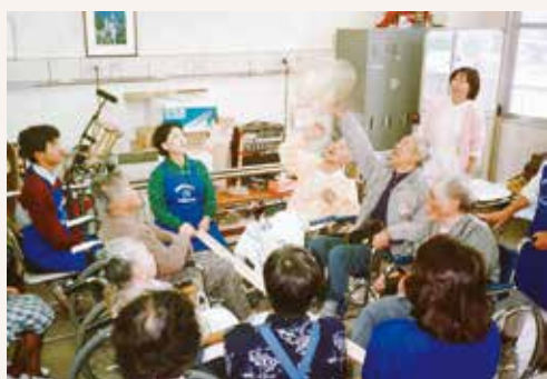
1992年 前橋協立病院で組合員ボランティアによる病棟レクが始まる。 1993年 デイケア施設「さくらんぼの家」開設