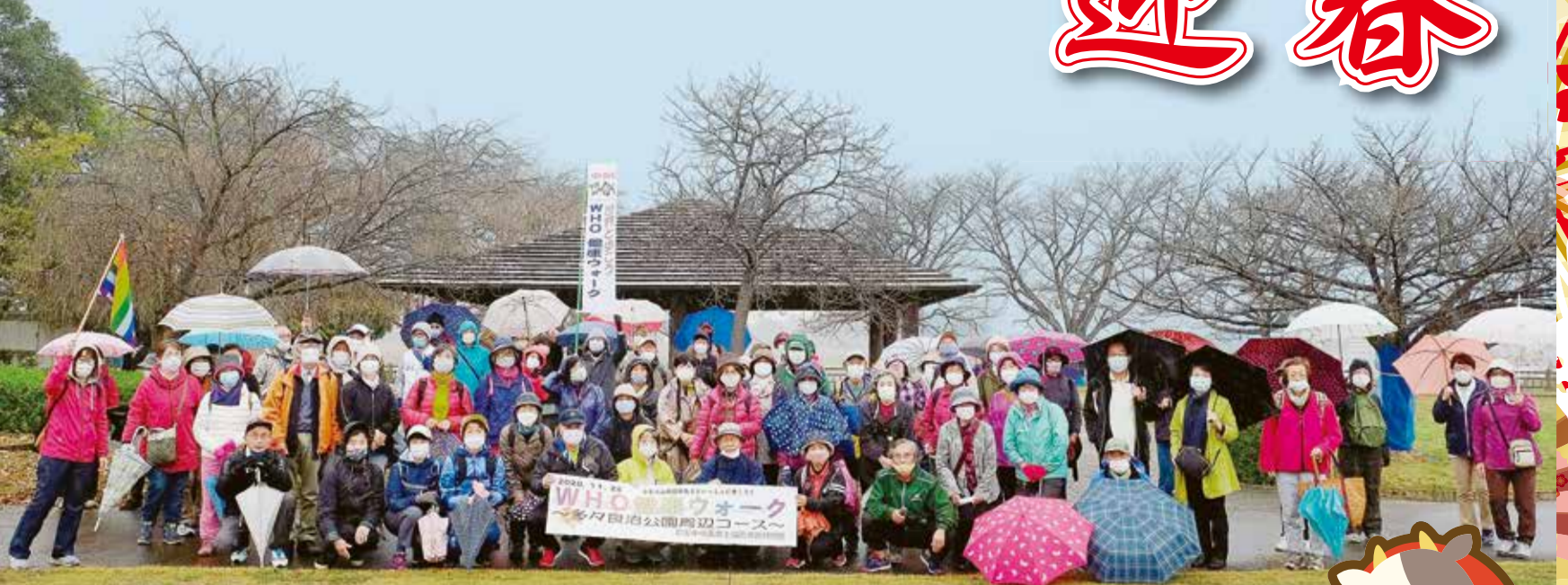
邑楽館林ブロック 多々良沼健康ウォーキング