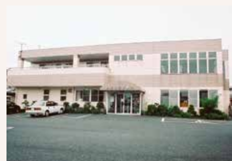
1995年 桐生協立診療所開設(桐生市相生町)