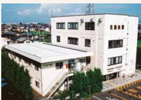
1996年 生協本部棟に生協会館4階を併設、1階に協立歯科クリニックを開設