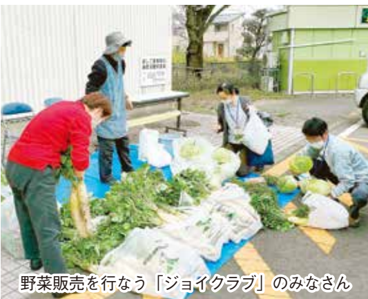
野菜販売を行なう「ジョイクラブ」のみなさん