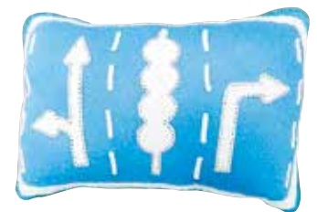
前橋市 小学生依頼針と糸を持った青年さん