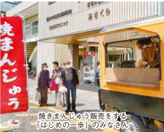
焼きまんじゅう販売をする「はじめの一步」のみなさん