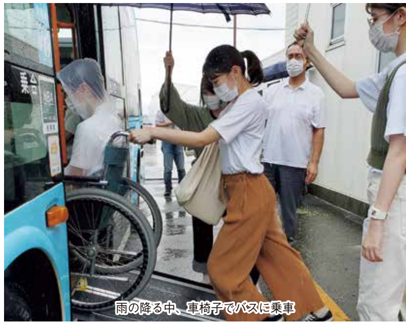
雨の降る中、車椅子でバスに乗車

そういう状況もあり、リハビリでは実際に町へ出向いて、利用者さんとバスや電車を利用する練習なども行っています。利用者さんと一緒に交通機関を利用してみると、