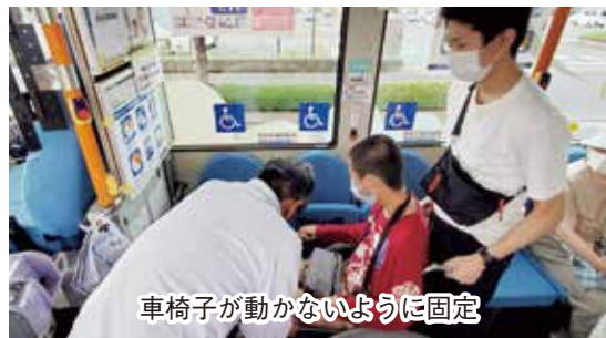
車椅子が動かないように固定

教室」というイベントが開かれました。これは、市民団体や前橋市の循環バスの運営会社様と医療生協が協力し、「バスに乗りたけれど、自信がない」という方々にバスの利用を体験していただく企画です。今回は「通所リハビリ未来」の利用者さん4名が参加されました。バスにはリハビリ職員も同乗し、利用者さんの身体機能に応じて助言や乗降のサポートなどをしました。