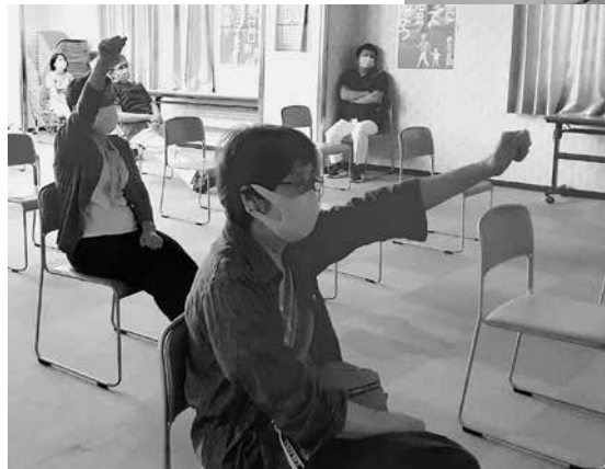
シュプレヒコールの様子