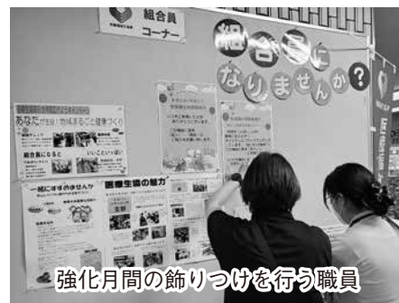
強化月間の飾りつけを行う職員