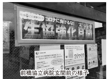
前橋協立病院玄関の様子