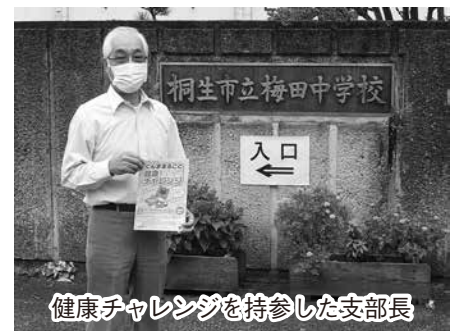
健康チャレンジを持参した支部長

ぐんままるごと健康チャレンジのキッズチャレンジを昨年参加した学校に加え、新しい学校にも紹介をして広めています。先日、山間にある梅田中学校を地元の支部長が訪ねました。学校長と養護教諭の方が対応して下さい、職員を含めて参加してもらえこととなりました。昨年参加している「梅田南小学校と連携してチャレンジしたいです」という力強い声をいただきました。