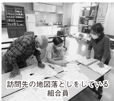
訪問先の地図落としをしている組合員

太田地区では、新型コロナウイルス感染症拡大がやっと落ち着いてきました。班活動ができなくて、会員さんがどうしているだろうか不安の日々が続いていました。