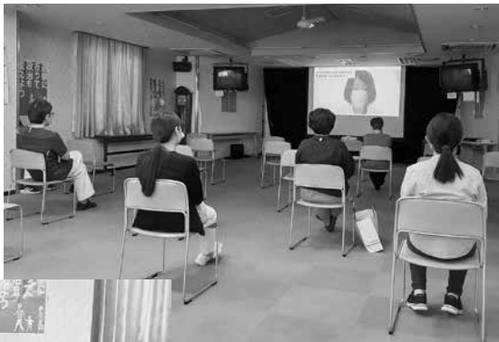
オンラインで参加する 組合員・職員

「いのちまもる10.14総行動」が東京日比谷野外音楽堂で開催されました。当生協では、新型コロナウイルス感染症流行の為、動画配信をそれぞれの会場で視聴しました。今年は、感染症による医療・保健・保育などの現場の厳しい状況をうけ、様々な立場の方から切実な報告いただきました。3会場合計で29人の参加があり、オンライン視聴であったものの最後はシュプレヒコールで、現地参加者と気持ちを一つにして閉会となりました。