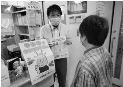
協立歯科クリニック

協立歯科クリニックでは、生協強化月間や健康づくりのチラシを準備し、診療後に歯科医師や衛生士から振込用紙と一緒に手渡ししています。その場で増資してくれる方もいますが、後日振込用紙で増資してくださる方もたくさんいます。10月1日は1日だけで新規加入5件もありました。増資も連日、多くの方から御協力いただいております。今後も患者さんや地域に寄り添った対応で歯科医療・予防事業を進めていきます。