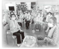
▲夏祭りのイベント