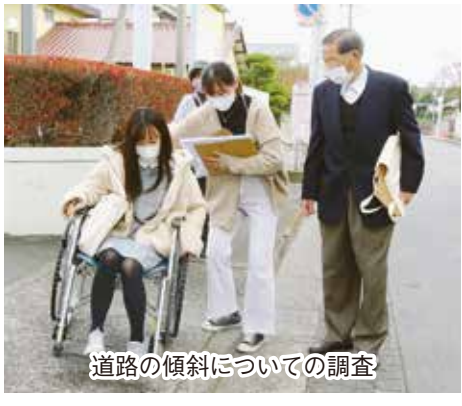
道路の傾斜についての調査