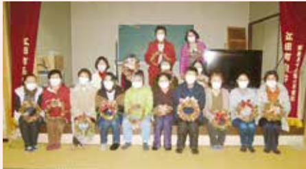
あずま滝川支部 クリスマス飾り