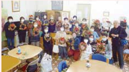
伊勢崎支部 クリスマスリース