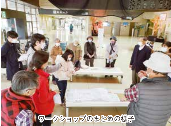
ワークショップのまとめの様子

当初は支部内でゆっくりと取り組むつもりでしたが、活動の趣旨に賛同いただいた前橋工科大学の教授や学生さんをはじめ、多くの市民団体の皆様にご協力をいただけることとなりました。