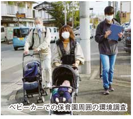
ベビーカーでの保育園周囲の環境調査

の危険な場所のみでなく、資源になりえる部分にも気を配り散策を行いました。行動後、それぞれのグループごとに気が付いたことなどの報告と感想を出し合いました。