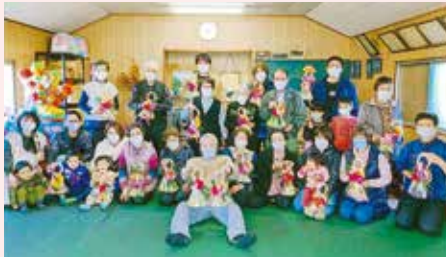
上川支部 子育て交流会・西原桜班・友交会 正月飾り