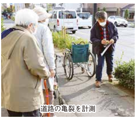
道路の亀裂を計測

後日の総括会議などを経て、文書にまとめ「街の環境改善」につなげるために当該地域の自治会長を通して前橋市の交通政策課等への申し入れを行いました。またこの活動を伝える聞いた住民からもある店舗への手すり