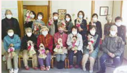
あずま支部 正月飾り