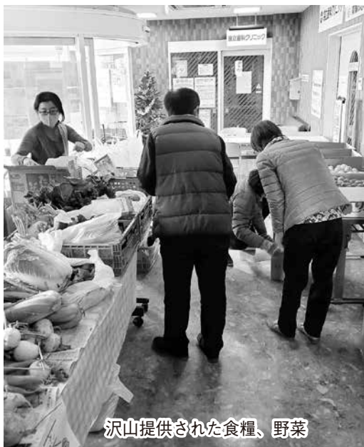
沢山提供された食糧、野菜