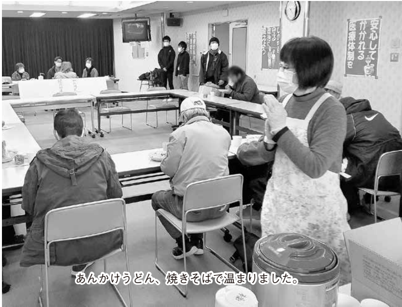
あんかけうどん、焼きそばで温まりました。

当日は早朝から提供予定の数十人分もの食事を仕込み、実際の相談・支援には約20名の組合員・医学生・職員ボランティアの参加があり、それぞれの役割を担ってもらいました。