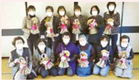
上川支部 ぬで島班 正月飾り