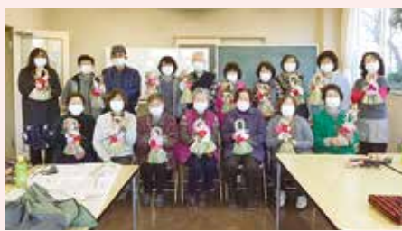
木瀬支部 正月飾り