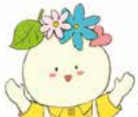
イメージキャラクター ちいまる

中毛地区組合員活動課 TEL027 (265) 3531 太田地区組合員活動課 TEL0276 (45) 4989 桐生地区組合員活動課 TEL0277 (55) 5777