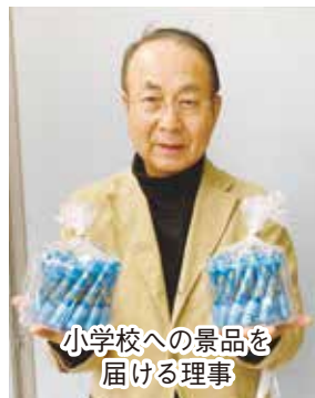
小学校への景品を 届ける理事

り組みを身近に感じ、チャレンジに参加することができました。また、チャレンジに参加された子どもたちにおいては、チャレンジの中で親子や家族の繋がりを強めるきっかけになったと思います。コロナ禍で繋がりが希薄となっていてこの時期に、医療生協が取り