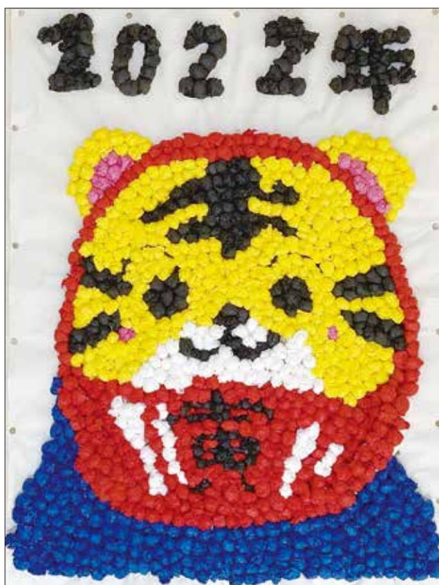
デイサービスさくらのみなさん