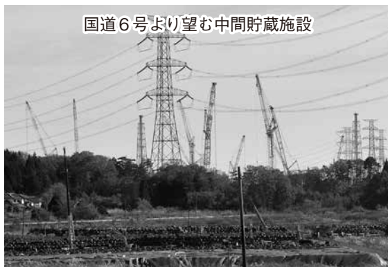
国道6号より望む中間貯蔵施設