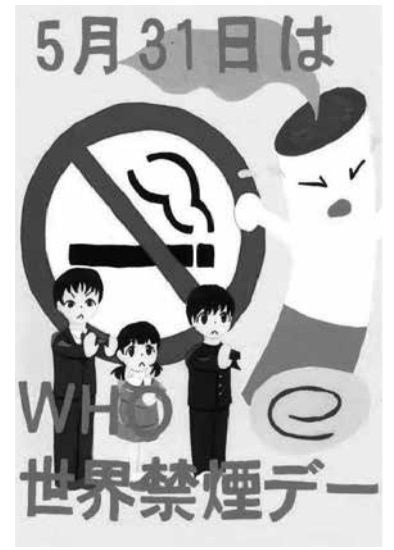
昨年の最優秀賞作品です。