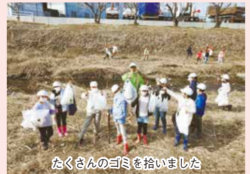
たくさんのゴミを拾いました

いました。子どもたちは、1時間程度で各々が持ってきたごみ袋が溢れる程熱心にゴミを拾っていました。集めたゴミは学校へ持ち帰り、分別して学びの材料としたようです。