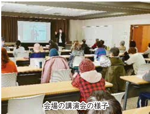
会場の講演会の様子

他の病気にならず、長生きできて認知症になったという考えで、あえて前向きな言い方と言えば、「誰でも120歳まで生きれば認知症になれる」と言えます。そして今やランドセルをしょっている小学生の数よりも認知症を患っている方が数多くなっている現状があります。決して認知症は特別な病気ではなく、私たちの身近にあるものになって