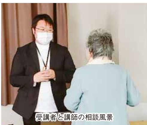
受講者と講師の相談風景