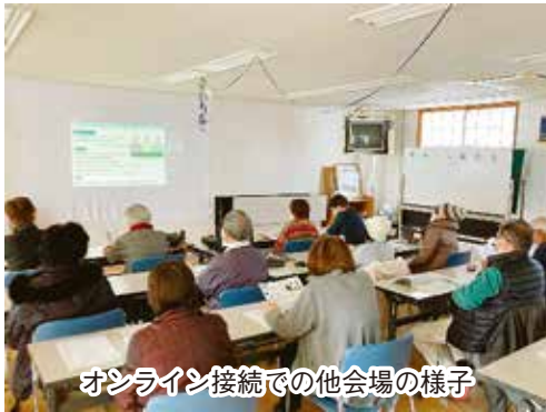
オンライン接続での他会場の様子