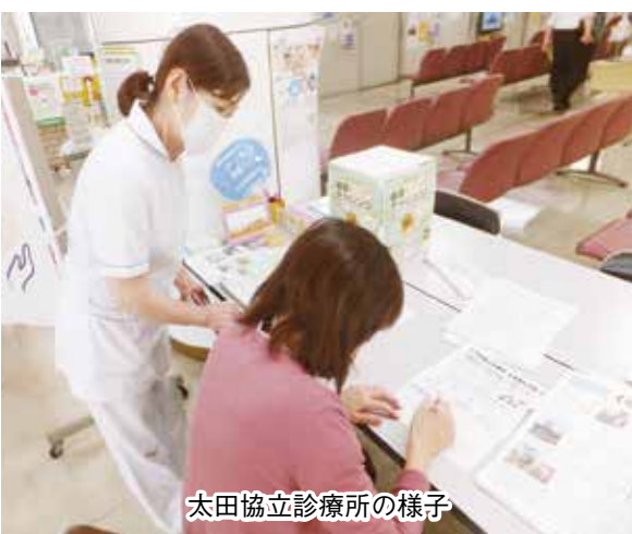
太田協立診療所の様子