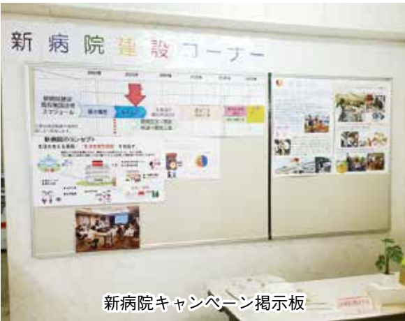
新病院キャンペーン掲示板

3年後に前橋協立病院の建て替えを控えている当生協ですが、物価や建設単価が著しく高騰していることもあり、簡単な建設事業ではありません。医療生協の病院として、医療機能のみではなく地域のコミュニティ拠点として、地域の皆さんの生活の支えや安心感をもっといただける病院になるように、組合員・職員で何度も協議をおこなってきました。私たちの目指す安心の医療・介護・地域づくりのために、組合員加入や出資にご協力ください。