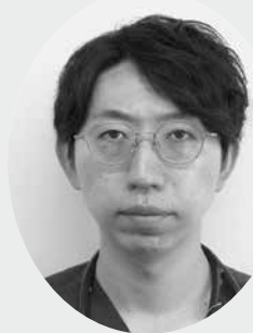
前橋協立病院 総合診療科・内科医師