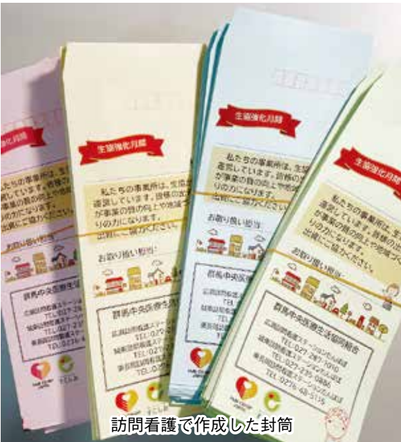
訪問看護で作成した封筒