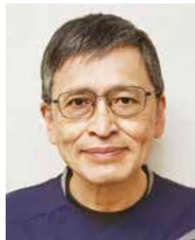
協立歯科クリニック 所長