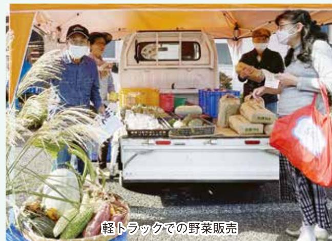
軽トラックでの野菜販売

桐生高校管弦楽部は年配の方々にも親しみやすい曲を演奏してくださいました。「マツケンサンバ」の演奏では客席