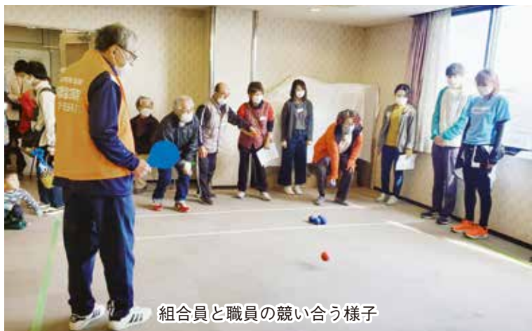
組合員と職員の競い合う様子

1歳から90歳代まで幅広い年代、組合員や職員、その家族、車いす利用者の参加もありました。世代間の交流、組合員同士、