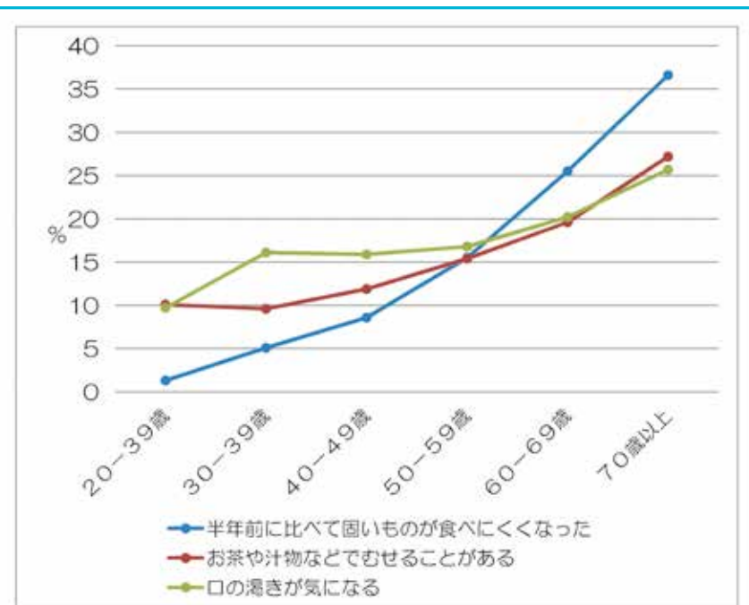
図2 口腔機能と年齢の関係性