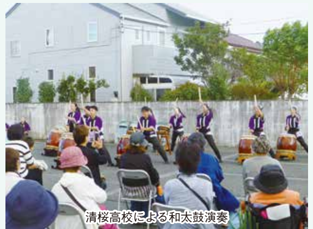
清桜高校による和太鼓演奏

ました。清桜高校和太鼓部の力強いばちさばき、演奏は元気いっぱい、パワーにあふれ、参加者の皆さんからは感嘆の声と大きな拍手が沸き起こりました。