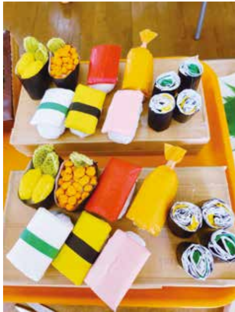
「牛乳パックで作ったおすし」 デイサービス城東利用者、職員一同