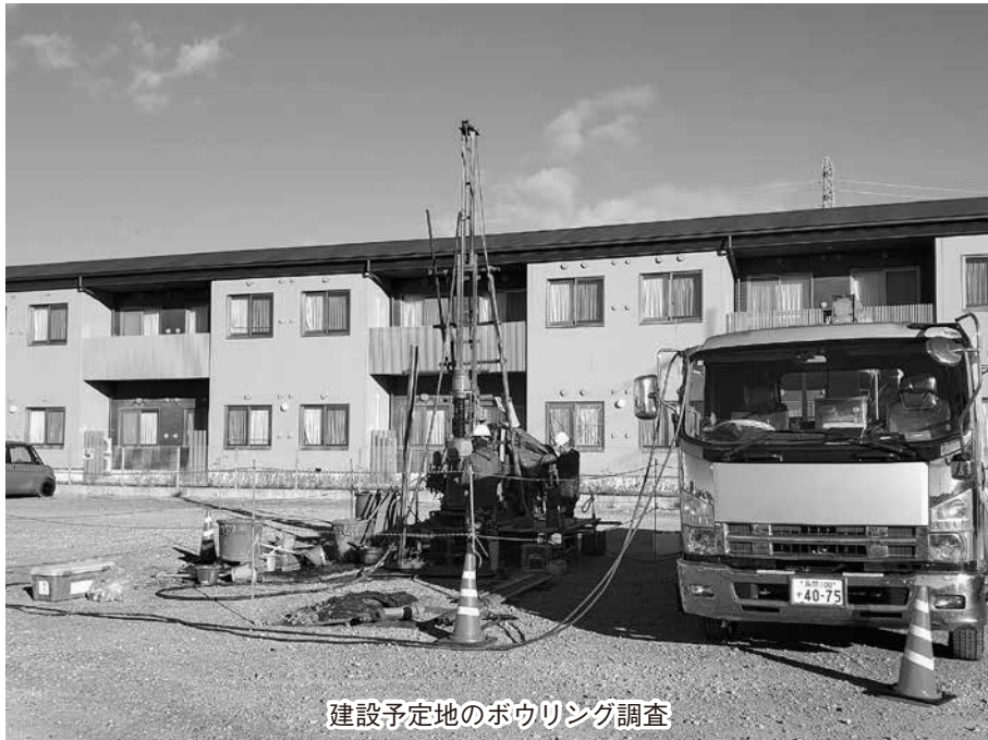
建設予定地のボウリング調査

前橋協立病院の新病院建設計画も、竣工予定まであと2年半となりました。2023年までは主に病院の診療機能に合わせた院内の平面図作成、敷地内の配置図作成をおこなってきました。建設単価の高騰もあり、費用と償還計画を見直しつつ、建設計画や図面の見直しを何度も行わなくてはならない難しい状況が続いています。2024年1月にはこれまで議論をおこなってきた新病院建設の経過を地域の組合員にお知らせするため、各地