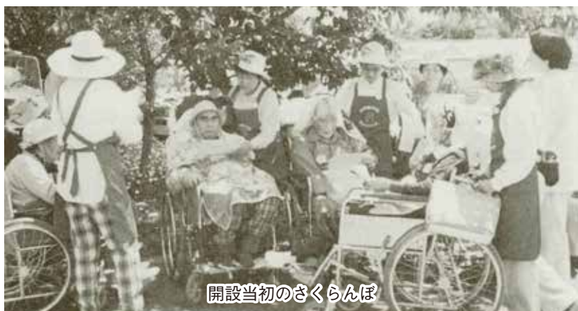
開設当初のさくらんぼ

おそれていたことが起きました。屋久島沖で米軍のオスプレイが不時着事故を起こしました。群馬の上空も一部がオスプレイの飛行訓練ルートになってい