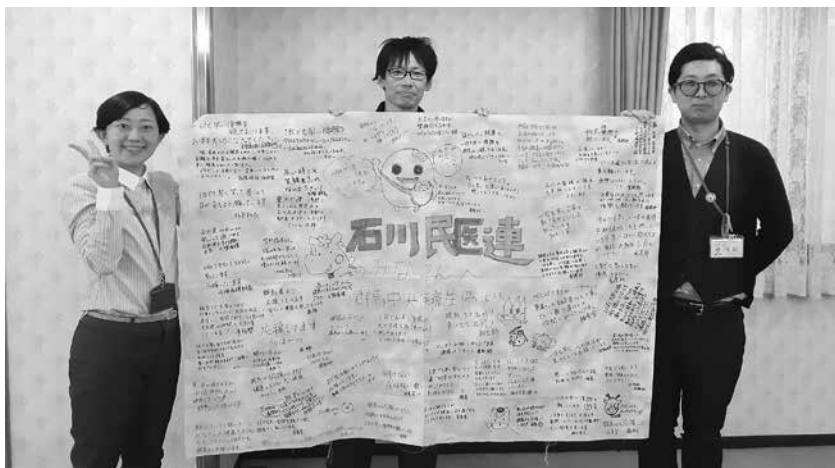
※民医連…全日本民主医療機関連合会