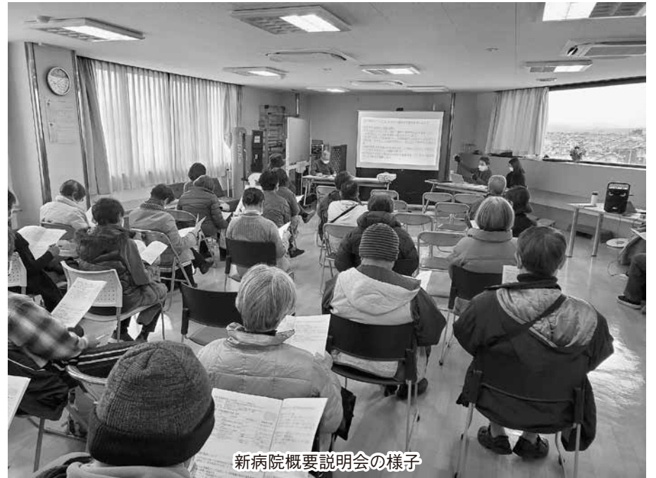
新病院概要説明会の様子