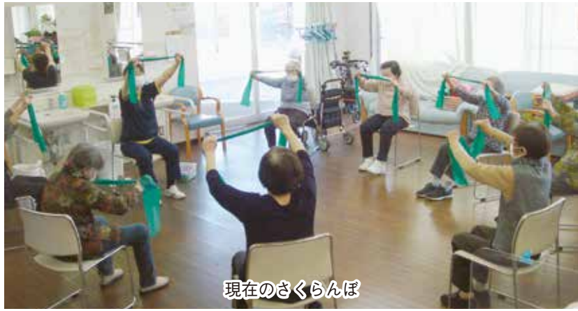
現在のさくらんぼ

高齢者、要介護認定者は増加しています。現在の社会保障環境では、在宅で生活をせざるを得ない方が増加する恐れがあります。その場合、介護する家族も仕事をし続け