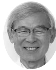
前橋協立病院 内科医師

「さくらんぼの家」がつくられて30年を超え、新しい「さくらんぼの家」が建設されることを夢みていたのですが、このたび閉鎖されて、デイサービス「虹」と統合されることになったとのこと、率直に言って悲しく残念です。1980年に建設された現在の協立病院は「寝たきりなんか認めない」を合言葉にして、無料の訪問看護活動を行なうなど、地域の医療介護に新しい風を吹きこもろうと頑張っていました。そのような活動に共感し、組合員さんたちが知人に声をかけてくれるなどして、ボランティアサークル「さくらんぼの会」を結成して下さいました。30人ほどの会員さんたちの支えがあった。1993年に入浴施設もある「さくらんぼの家」が建